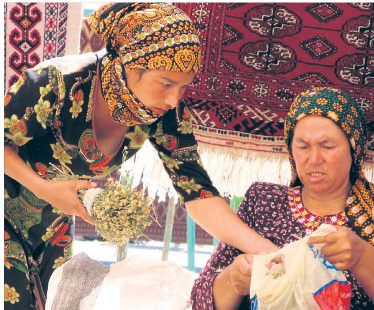
Zwei Frauen in turkmenischen Aschkabat: Dort befindet sich eine der größten und eindrucksvollsten Teppichmärkte in Zentralasien.