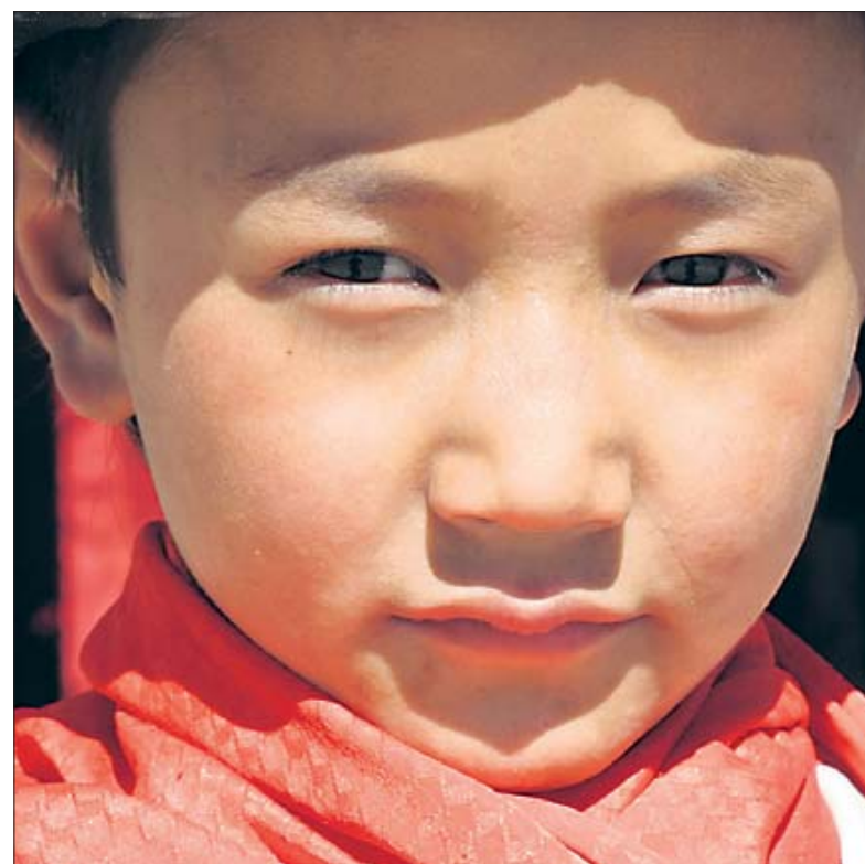
Ein chinesisches Mädchen am Straßenrand beobachtet die Frau mit dem Motorrad ganz genau.