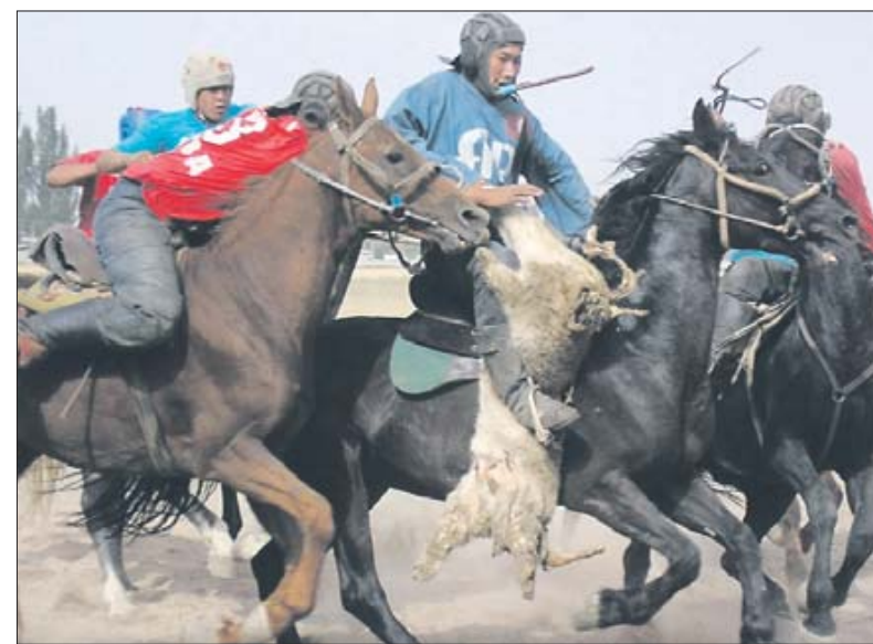
Reiterspiele haben in Kirgistan eine lange Tradition: Früher haben daran bis zu 1000 Reiter teilgenommen.