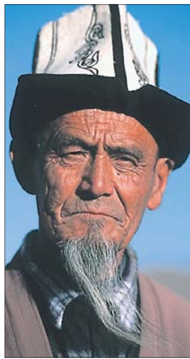
Stolzer Kirgise auf dem Pamir-Plateau in Tadschikistan.

Seide, Gewürze, Porzellan und Edelsteine, aber auch das Schwarzpulver und die Pest seien