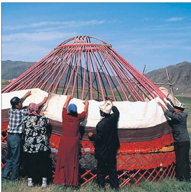
Im Herbst ziehen die Nomaden in tiefere Regionen Kirgistan: Sie bauen ihre Jurte in der Nähe des Issyk-Kul-Sees auf.